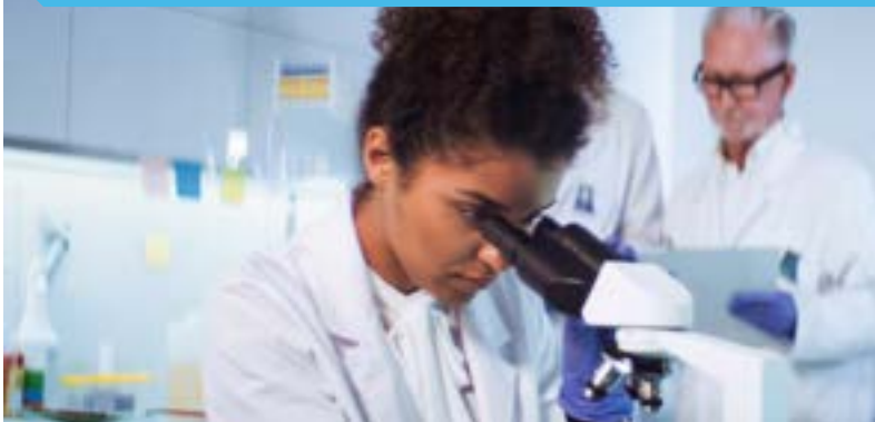
PROGRAMA DE ENSAYOS FASE 1

Hable con su médico para analizar si un ensayo clínico podría ser adecuado para usted, y para conocer sus opciones.